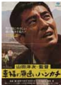
「幸福の黄色いハンカチ」1977

お申し込み・お問い合わせは Tel.090-4499-1438 みのお(ぶんぶん)まで