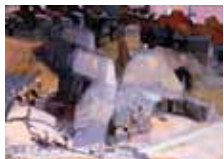
辻愛造(燈台と家)1956年 西宮市大谷記念美術館蔵

同館の展覧会とコレクションがどのように関わってきたかを、過去の展覧会を振り返りながら紹介する。