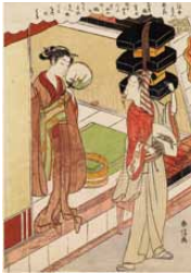
鈴木春信「浮世美人寄花 踏考娘・羅妻」 明和6年(1769)頃 中判錦絵 ポストン美術館蔵 William Sturgis Bigelow Collection, 11.19518

その作品の8割以上が海外に所在し、日本での展覧会の開催が最も難しいといわれる浮世絵師・鈴木春信。質・量ともに世界最高の春信コレクションを誇るポストン美術館の所蔵品から選りすぐりの作品を展覧する。